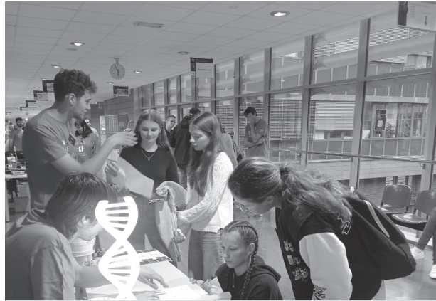
Študenti 2.G a sexty navštívili Brno