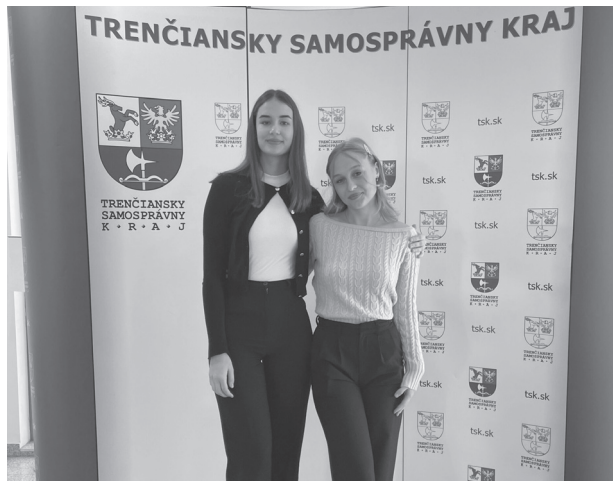
Stretnutie Krajského mládežníckeho parlamentu