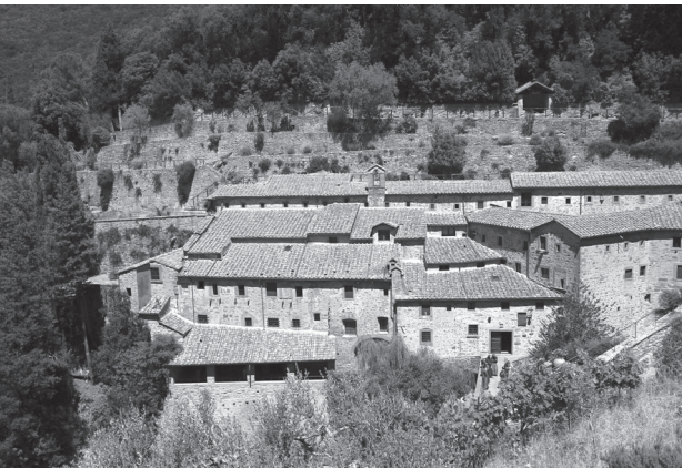
Kláštor La Celle pri Cortone

Jednoduchý kláštor, pustovňa, tu začali stavať františkáni už v roku 1235 z poverenia brata Eliasa, generálneho predstaveného. Postavili oratórium, malý refektár a päť ciel veľkosti cely sv. Františka. Po asi storočí františkáni miesto opustili a až od roku 1537 tu postavili svoj kláštor