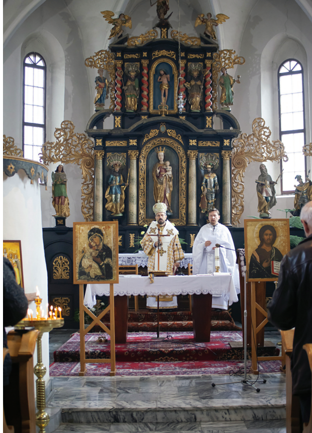
Gréckokatolícku farnosť v Prievidzi navštívil vľadyka Milan Lach, 6. októbra 2024