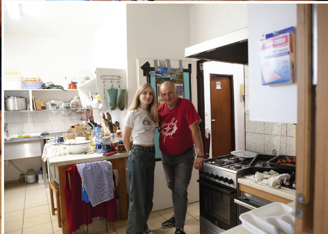
Stretnutie dobrovoľníkov a zamestnancov charity v Prievidzi, 28. septembra 2024