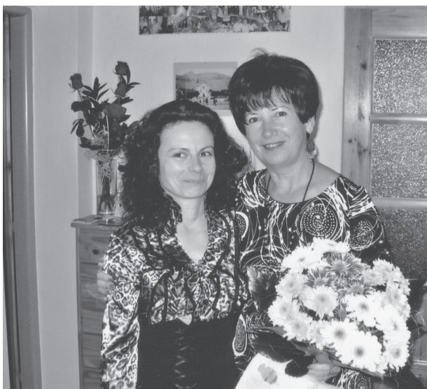
Kvetinárstvu sa venuje mama i dcéra