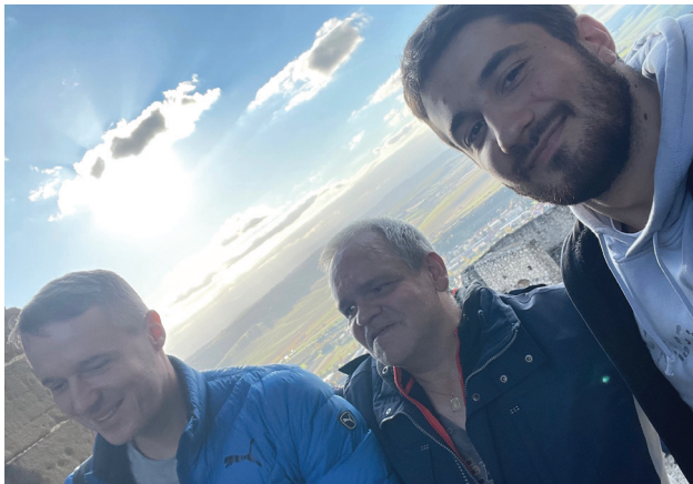
Farská púť do Levoče a Spišskej Kapituly, 12. októbra 2024