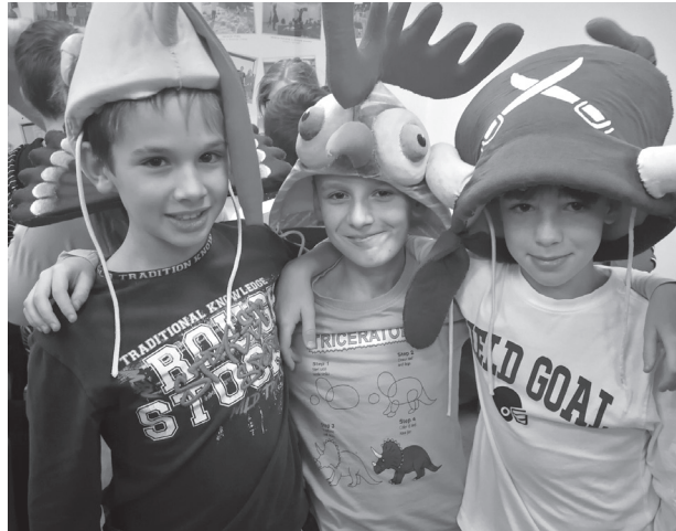
Rozprávka pre štvrtákov v Hornonitrianskej knižnici

Pripravila: Elena Blašková