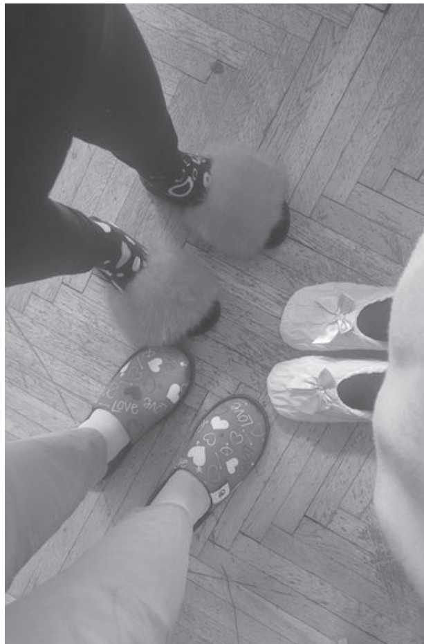
Papučový deň na podporu mobilných hospicov