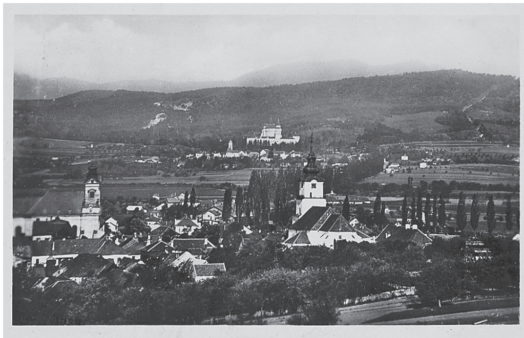
Pohľad na časť bývalej farskej záhrady s „vytrčajúcou“ strechou starej fary.

Historia Parochiae. Archív Rímskokatolíckej cirkvi Farnosť Prievidza-mesto.