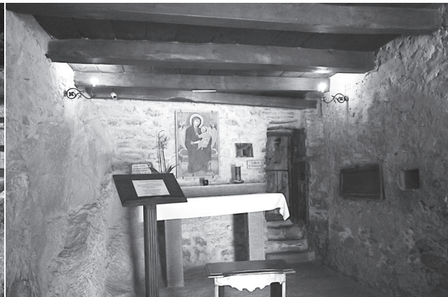
Cela, v akej býval sv. František